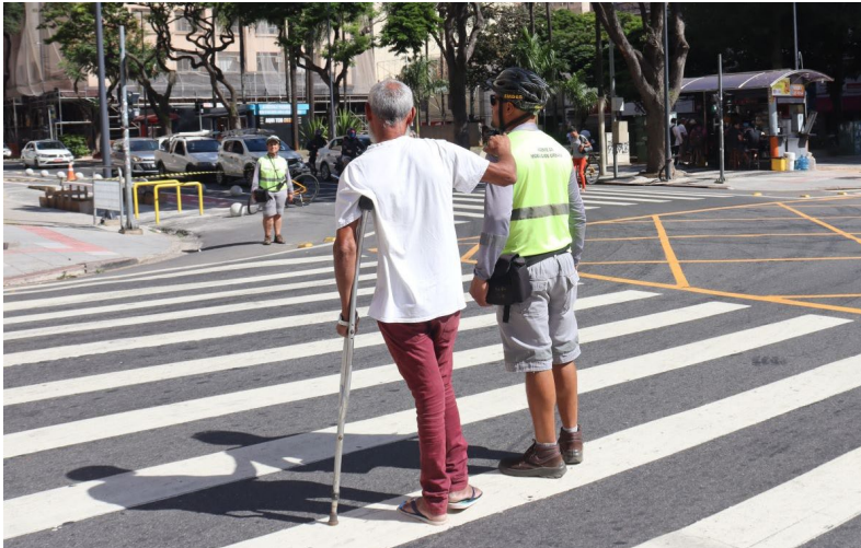
Pedestres atravessando a - Av. Campos Sales x av. Francisco Glicério -