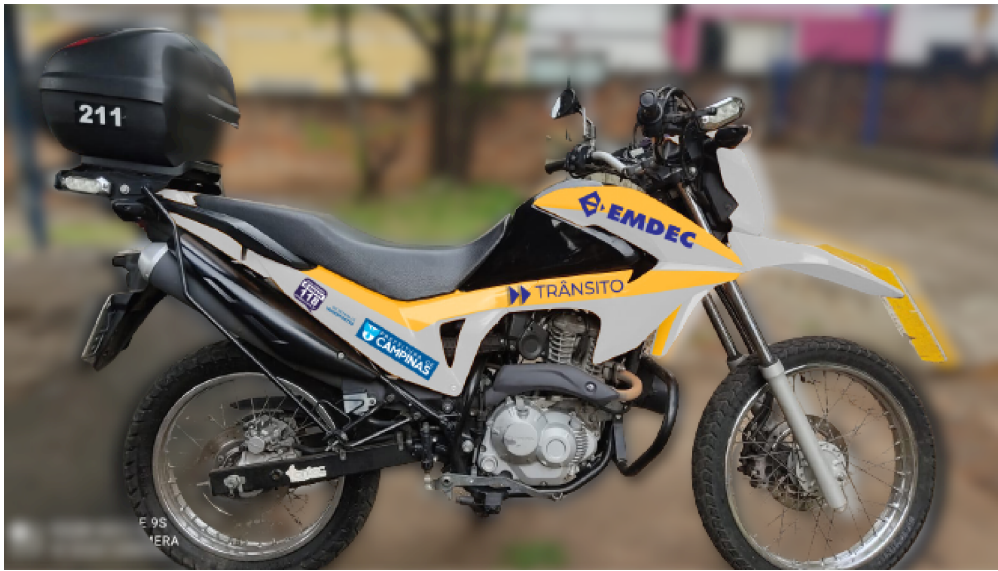
Modelo de envelopamento do veículo de fiscalização da Zona Azul Digital