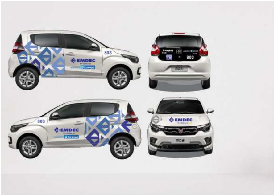
Modelo de envelopamento do veiculo operacional