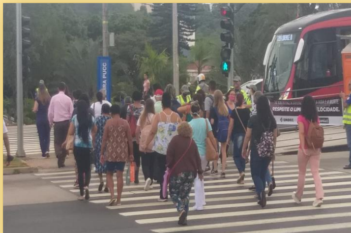
Pedestres atravessando a Avenida John Boyd Dunlop – Foto: Emdec. 2022.

Maio Amarelo é um movimento que visa a preservar a vida no trânsito, através de ações coordenadas entre poder público e sociedade civil.